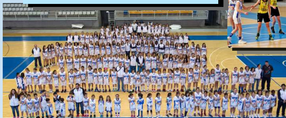
Pabellón Pedro Ferrándiz

Casi siempre “a cubierto” y en las mejores instalaciones posibles; aunque a veces entrenamos al aire libre, en la Ciudad Deportiva , el 90 % de nuestros entrenamientos son EN PABELLÓN CUBIERTO , ya sea en el Rafa Pastor-Pitiu Rochel , en el antiguo Centro de Tecnificación, ahora llamado Pabellón Pedro Ferrándiz (pista Anexa y/o Central) o en el pabellón del Instituto Miguel Hernández