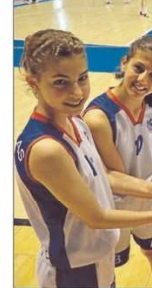
Las ocho jugadoras del San Blas alicantino se preparan para el campeonato de España alevín e infantil