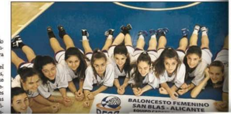
BALONCESTO FEMENINO SAN BLAS ALICANTE EQUIPO SENIOR