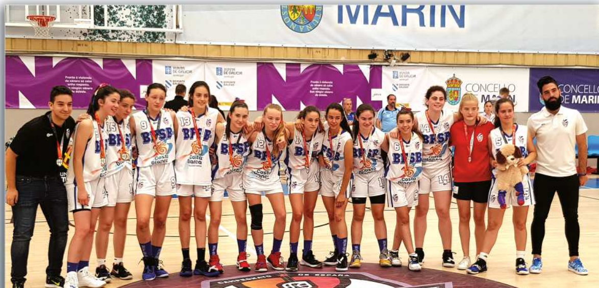
Campeonato de España Infantil 2019, tras caer en Cuartos de Final contra el Barca CBS