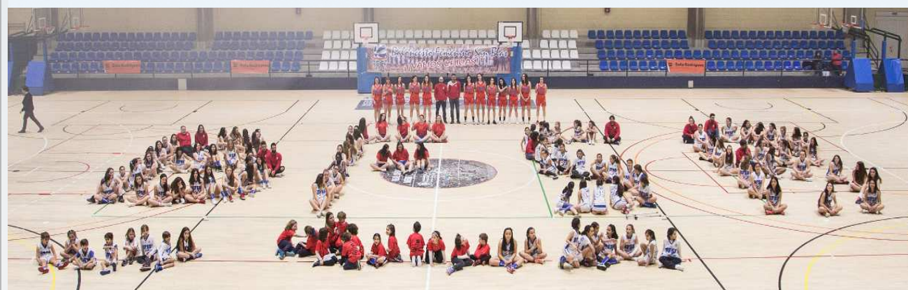
Pabellones Pitiu Rochel y Rafa Pastor