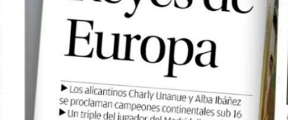
Charly Unanue lleva la copa de campeón del Europeo U16

Un triple del jugador del Madrid dio el título